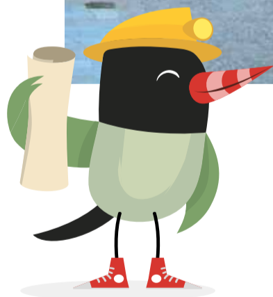
Il picchio, la mascotte del PISU (Progetto Integrato Sviluppo Urbano).