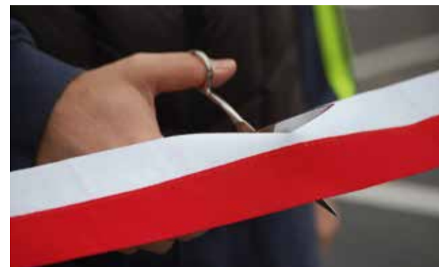
Il taglio del nastro per l'inaugurazione dell'area ex Eliporto.

Entro metà dicembre sarà completato il tratto compreso tra vicolo Cattedrale e piazza Galimberti. Sarà così possibile passeggiare in Via Roma, tra il Municipio e la piazza salotto della città, ammirando le facciate riportate al loro antico splendore e illuminate dalle luci di Natale