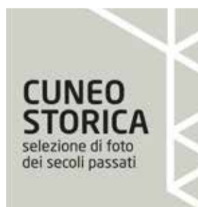
Mostra temporanea con foto storiche di via Roma [a pag. 4].