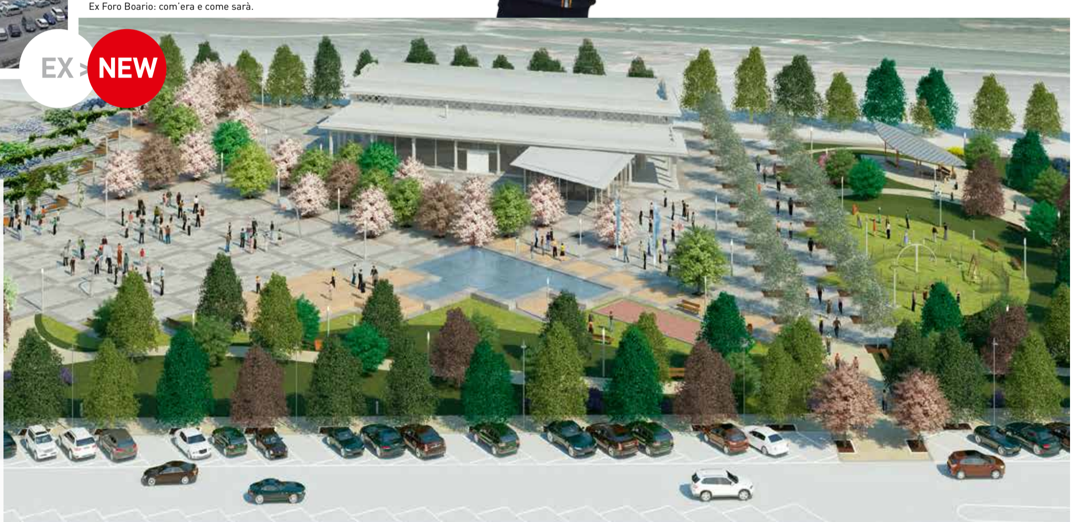
Ex Foro Boario: com'era e come sarà.

Nuovo polo per servizi e artigianato I lavori di recupero - già avviati - sono stati affidati, come avvenuto per la Tettoia Vinaj, con la procedura del project financing . Il consorzio che si è aggiudicato la concessione ne curerà la ristrutturazione e la gestione per i prossimi trent'anni. L'edificio che si affaccia sulla piazza ospiterà insediamenti commerciali, attività artigianali e servizi per i cittadini.