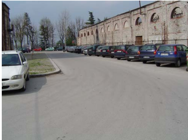
Foto: viste stato attuale