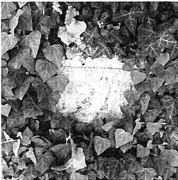
AUSTRIACI ANNO 1916