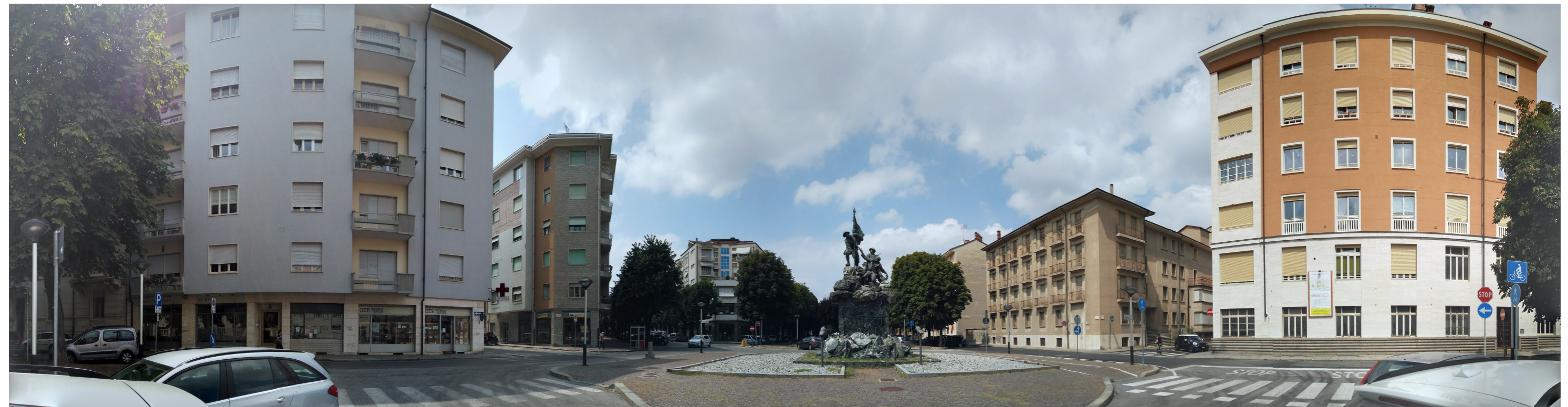
Viste generali da Corso Dante