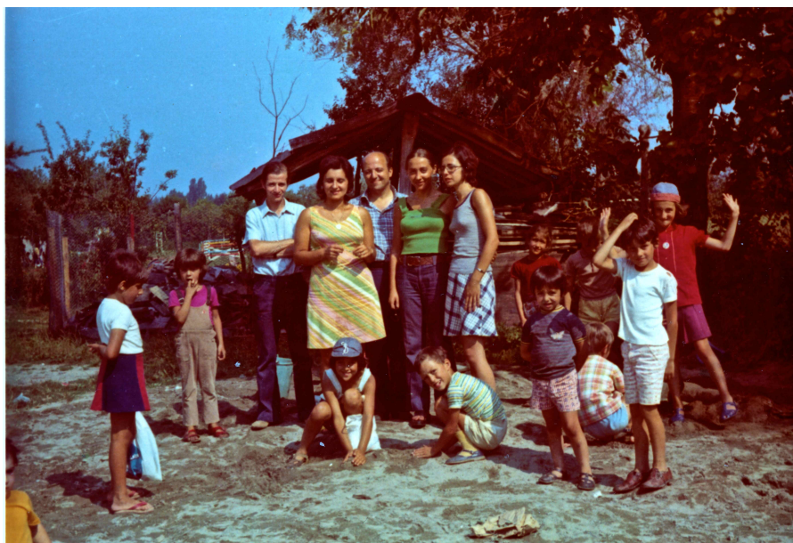
Fotografia 1. Parco "Robinson" 1973.