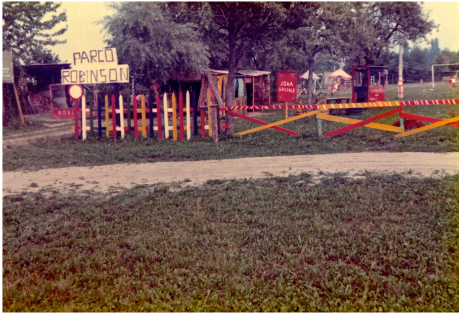
Fotografia 4. Parco "Robinson" 1974 (?). Ingresso all'area.