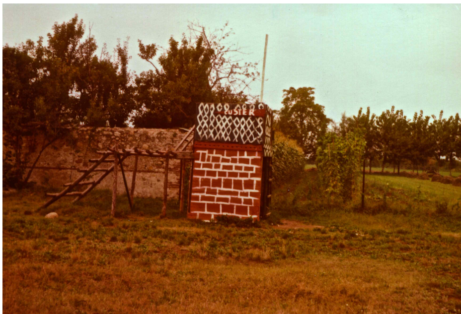
Fotografia 5. Parco "Robinson" 1974 (?). Piccolo castello-fortino costruito lungo il muro della confinante cascina Godassa.