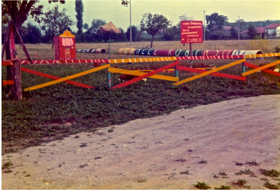
Fotografia 6. Parco "Robinson" 1974 (?). Staccionata di confine dell'area. Si noti il cartello rosso recante la scritta: "Parco Robinson organizzato dalla amministrazione comunale di Cuneo" .