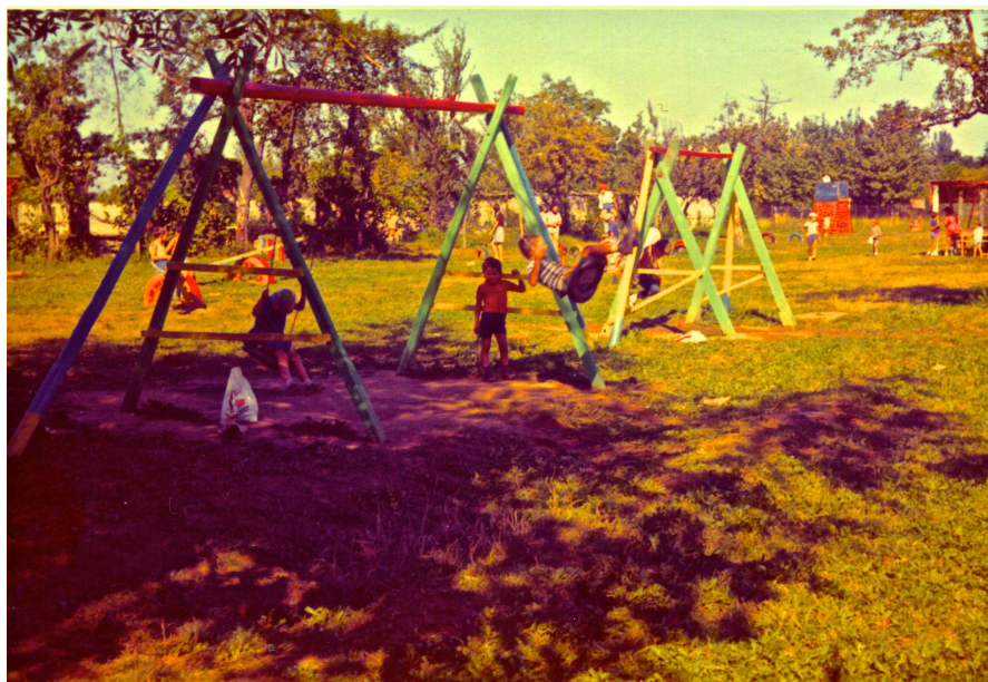
Fotografia 2. Parco "Robinson" 1974 (?). Area giochi.