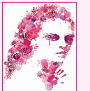
Rete Antiviolenza Cuneo

Il GS Roata Chiusani in collaborazione con il Comune di Cuneo, con il contributo della Fondazione CRC e con la partecipazione di