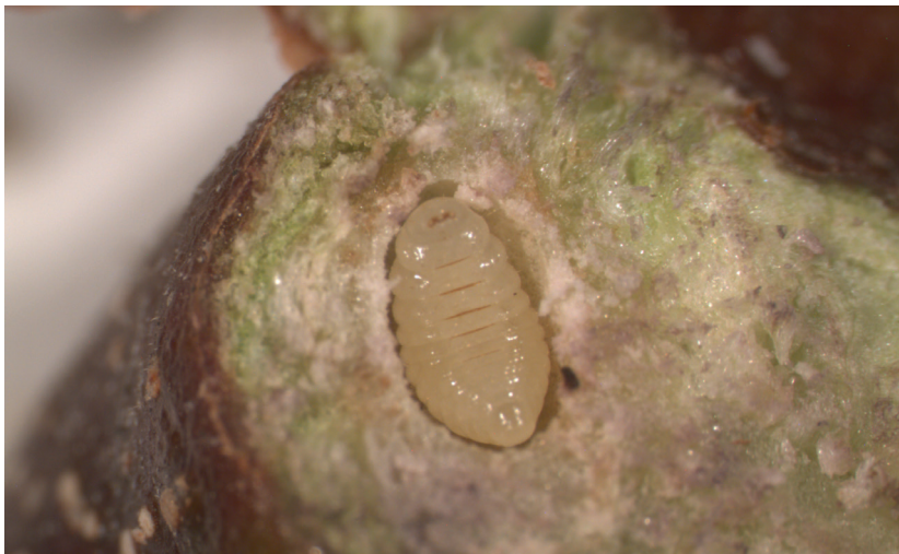
Larva di T. sinensis nella celletta all'interno di una galla dissezionata

I sopralluoghi di campo già condotti nella primavera 2019 hanno accertato come il parassitoide T. sinensis , oggetto di rilascio negli anni passati, sia presente allo stadio di larva all'interno delle galle in tutti i siti indagati e in alcuni in elevate percentuali, fino al 70%.